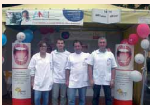
Stand Festival Salute con poster Oral Cancer Day.