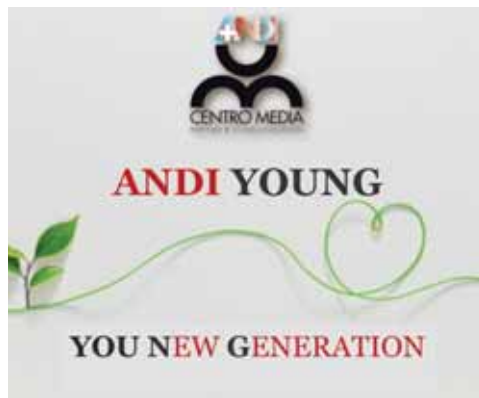
Il logo del Progetto "ANDI Young".