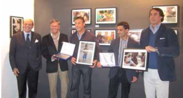
Il Presidente Fondazione ANDI con i premiati del concorso fotografico.

Grande successo per Fondazione ANDI all'edizione 2012 dell'International Expodental, la più importante fiera del settore dentale che si è svolta a Milano dal 18 al 20 ottobre. Grazie alla collaborazione con UNIDI - Unione Nazionale Industrie Dentarie Italiane -, la nostra Fondazione è stata tra i protagonisti della manifestazione di cui ha saputo diventare "l'animo solidale". Fondazione ANDI, che ha come obiettivo quello di promuovere la cultura della solidarietà in campo odontoiatrico, grazie a questa preziosa collaborazione ha potuto così rispondere in modo concreto alle tante richieste dei professionisti del mondo del dentale che si vogliono attivare per essere di aiuto agli altri, dimostrandosi ancora una volta il punto di riferimento per quanti, in particolare, desiderano diventare volontari in missioni di solidarietà all'estero. Per questo, per l'intera durata della manifestazione, Fondazione ANDI ha potuto disporre di uno spazio esclusivo, lo Speakers' Corner , dove, in un clima informale di dialogo e di scambio reciproco, i responsabili dell'associazione, i medici volontari