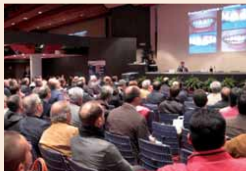
Un momento del XVIII Congresso Dentalevante. A destra la locandina del Congresso.

Quest'anno l'ANDI Bari/Bat ha voluto coinvolgere sia tutte le sezioni provinciali pugliesi sia l'AIO Bari, confermando l'obiettivo del sindacato di interazione