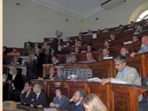
I discendenti del corso all'interno dell'Aula Carle.