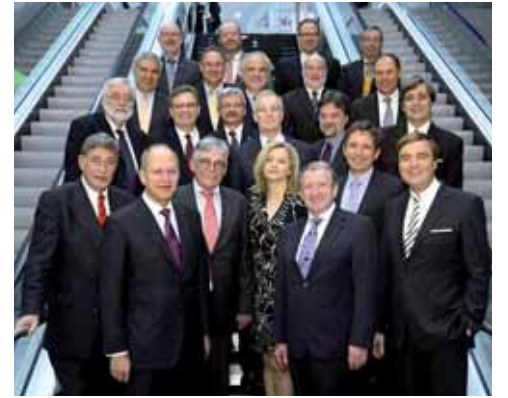
La Delegazione ANDI insieme ai membri delle associazioni tedesche BZÄK, DGZMK e KZBV.